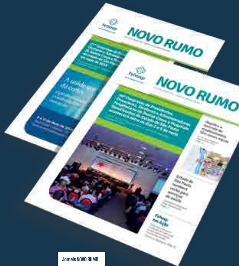
Jornais NOVO RUMO