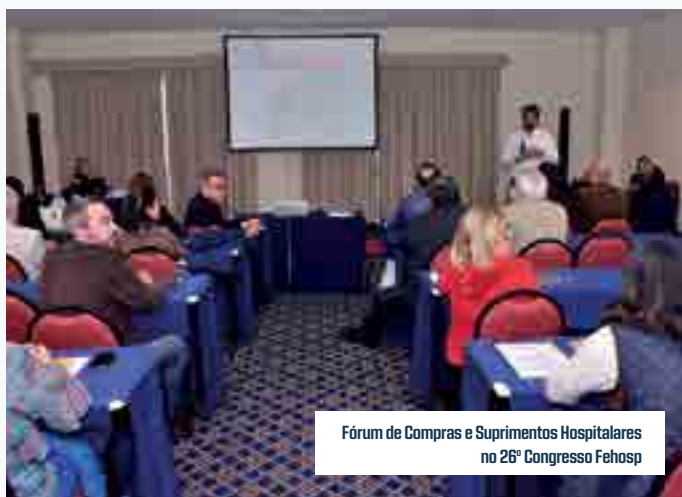
Fórum de Compras e Suprimentos Hospitalares no 26º Congresso Fehosp