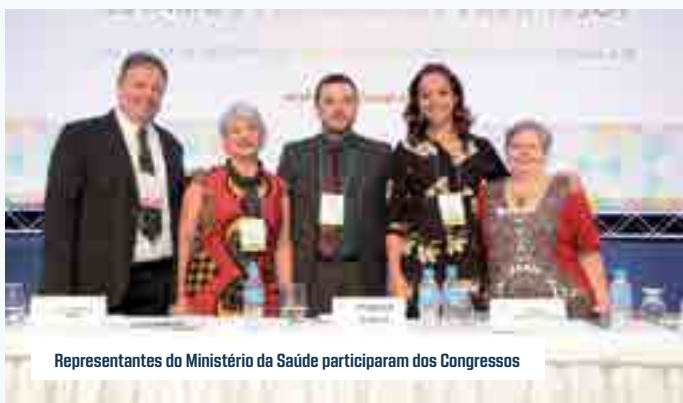
Representantes do Ministério da Saúde participaram dos Congressos