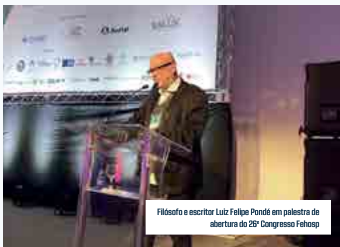
Filósofo e escritor Luiz Felipe Pondé em palestra de abertura do 26º Congresso Fehosp