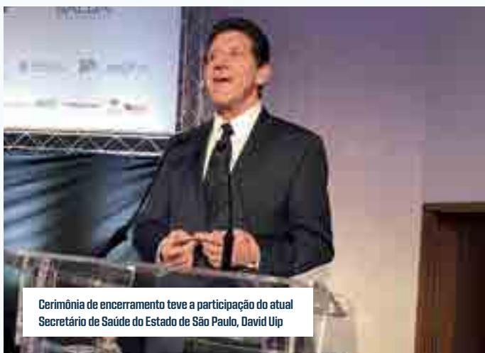
Cerimônia de encerramento teve a participação do atual Secretário de Saúde do Estado de São Paulo, David Uip