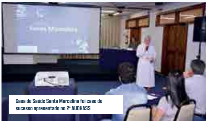
Casa de Saúde Santa Marcelina foi case de sucesso apresentado no 2º AUDHASS