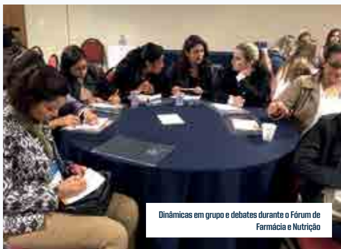
Dinâmicas em grupo e debates durante o Fórum de Farmácia e Nutrição