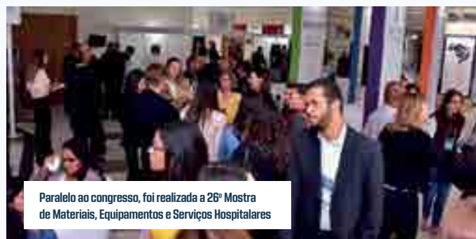
Paralelo ao congresso, foi realizada a 26ª Mostra de Materiais, Equipamentos e Serviços Hospitalares

Paralelamente ao 26º Congresso, houve a realização de nove fóruns técnicos, nos quais foram apresentados os temas: Gestão de Custos, Nutrição e Farmácia, e Sistemas de Gestão, T.I. – Inovações Tecnológicas, Comunicação Interna e Externa, Compras e Suprimentos Hospitalares Sustentáveis, Gestão de Pessoas, Jurídico e Qualidade e Segurança do Paciente.