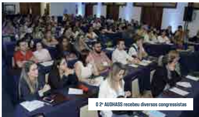
O 2º AUDHASS recebeu diversos congressistas